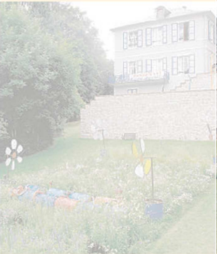
Le tour des neuf jardins se termine avec «Robratifs».

La douceur des courbes des Ondules laisse la place au dernier des jardins rotatifs de ce festival des Jardins Métissés du Parc de Wesserling. Si le site est un espace jardin depuis 1699, il a vécu une nouvelle fois avec neuf installations et le regard d'artistes contemporains.