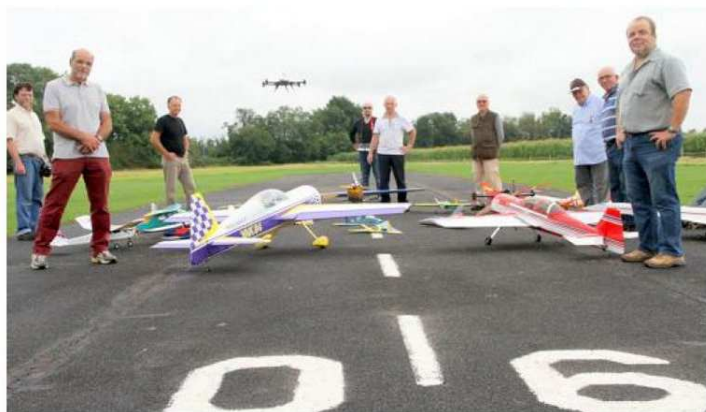
Une partie des membres du club, posant avec leur modèle réduit sous la surveillance d'un drone.

300 km/h, évolution d'hélicoptères de vitesse, jeux aériens (piquer de ballon, largage de bonbons, chasse à la banderole) et exposition des maquettes d'avions qui se sont illustrés lors du débarquement et de la bataille de Normandie compléteront ce show. Le prix d'entrée sera de 2 € (gratuit pour les enfants de moins de 12 ans), sachant que les 1 000 premières entrées bénéficieront d'un bon de réduction de 2 € pour une entrée au Parc du Petit Prince à Ungersheim. Buvette et restauration sur place. ■