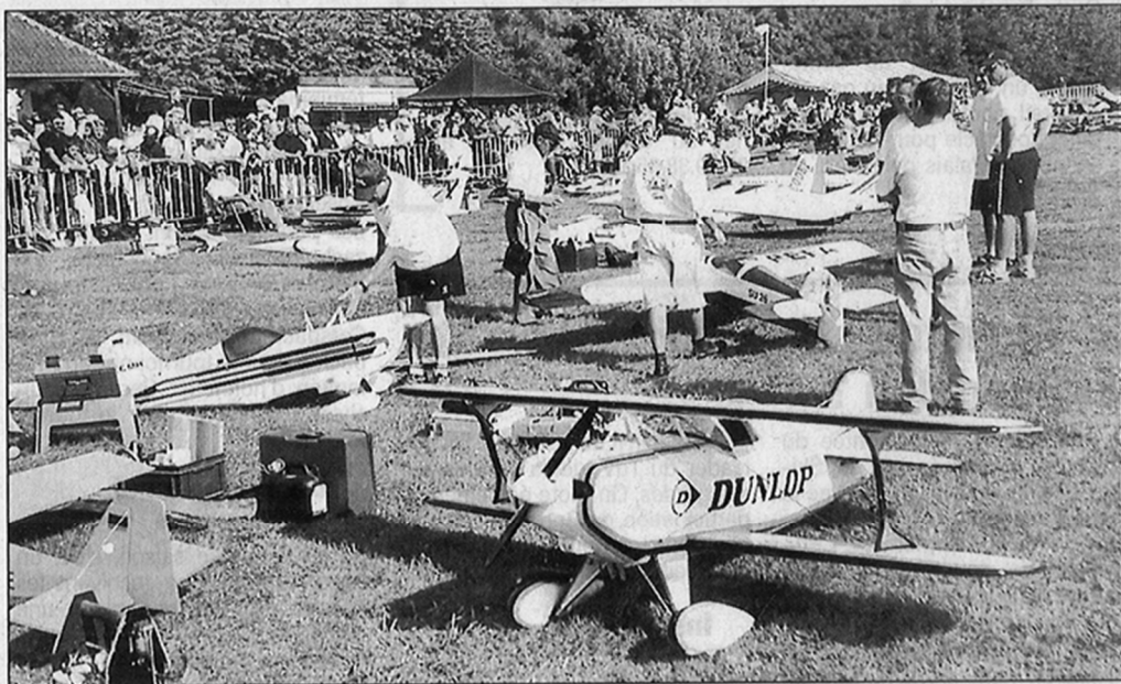
Des modèles réduits d'une envergure de 3 mètres pesant jusqu'à 25 kg, et équipés de moteurs de plus de 100 cm 3 seront présents mais également des jets miniatures capables d'atteindre les 300 km/h.

Parallèlement, le parc d'avions restera en exposition permanente