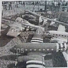
Les maquettes des avions mythiques du débarquement en Normandie.