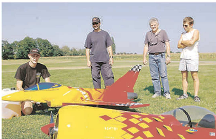
Avions à hélice ou à réaction se côtoient sur le terrain de l'Ochsenfeld.

Il y a aussi les passionnés de voltige, d'hélicoptères, de planeurs (dimanche, on en verra un de 13 m d'envergure) et même d'amusement, et là les membres du club admettent qu'il n'y a pas de limites! A côté du magnifique Super Constellation quadri-moteur de 4m30 d'envergure, on devrait donc retrouver une baignoire ou un éléphant rose, habitués des meetings et du terrain de l'Ochsenfeld.