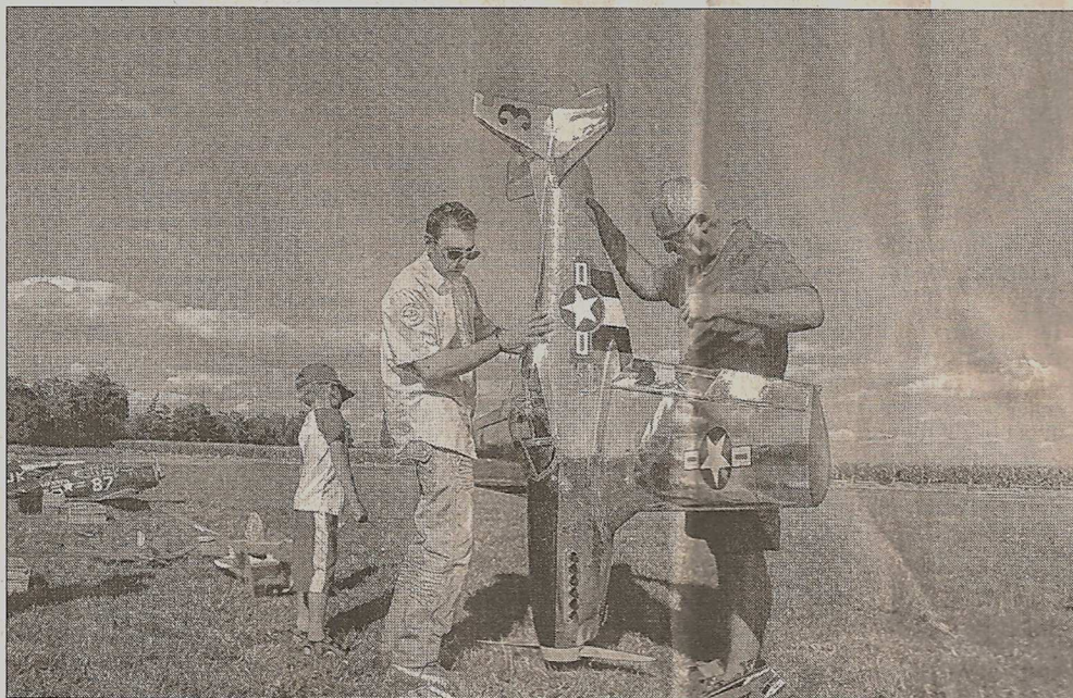
Entre 2 000 et 3 000 personnes se pressent tous les deux ans à Cernay pour suivre les performances des modèles réduits toujours plus perfectionnés.

Sur le thème des avions ayant participé à la Deuxième Guerre mondiale, plus de 200 engins volants de toutes sortes, venus d'Alsace, de Franche-Comté, d'Allemagne et de Suisse, vont prendre les airs, tels le DC-3 Dakota, le B-25 Mitchell (un bombardier de 4 m d'envergure), des warbirds, le Mustang P-51, le Corsair, mais aussi le Messerschmitt Komet ou le Dornier Pfeil. Après les vols libres le matin, un grand show, l'après-midi, mettra en scène des avions de ligne, des mythes comme le Constellation, des avions à réaction au kérozène ou électrique, des hélicoptères et des drones. A suivre aussi une chasse à la banderole, un lâché et creuvé de ballons et un ballet de modèles exotiques. Tarif : 3 €.