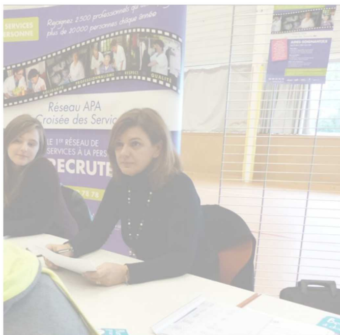
le du recrutement au sein du réseau APA. Dans ce domaine de l'aide à la

roulée hier à la Mab à Soultz. Plusieurs personnes sont recrutées.