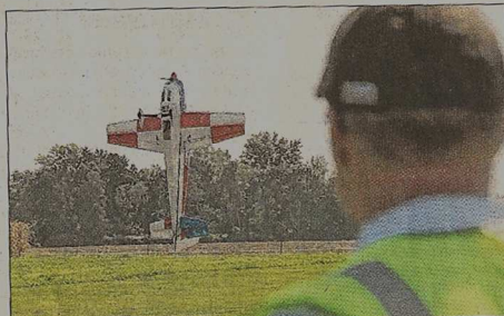
Une spectaculaire démonstration de voltige aérienne.