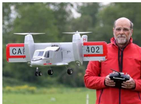
Décollage vertical d'un canadiar ayant des ailes pivotantes.

sant 20 kg, avec un réacteur de 16 kg de poussée, vitesse 270 km/h), télécommandé par Christian Kurtzemann. Prochains rendez-vous dimanche 26 juin pour la journée des doudous et dimanche 4 septembre lors le 21e Grand Meeting International d'Aéromodélisme. ■