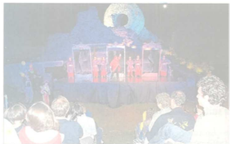
Le spectacle a été présenté mercredi, jeudi, vendredi, samedi et dimanche sur le site de l'Engelbourg.