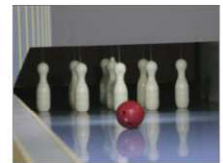
Les prix seront remis dimanche à Cernay.

Équipes dames : Drôles de dames 227 points ; Croix-Rouge 196 points ; Donneurs de sang 195 points.