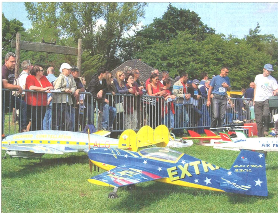
Le meeting d'aéromodélisme aura lieu dimanche 5 septembre, de 13 h 30 à 18 h, sur le site de l'Ochsenfeld à Cernay.

L'aéroclub de l'Ochsenfeld organise son grand meeting aérien, dimanche 5 septembre, à Cernay. Les pilotes, français, allemands ou encore suisses, sont quatre-vingt à avoir répondu à l'invitation des organisateurs.