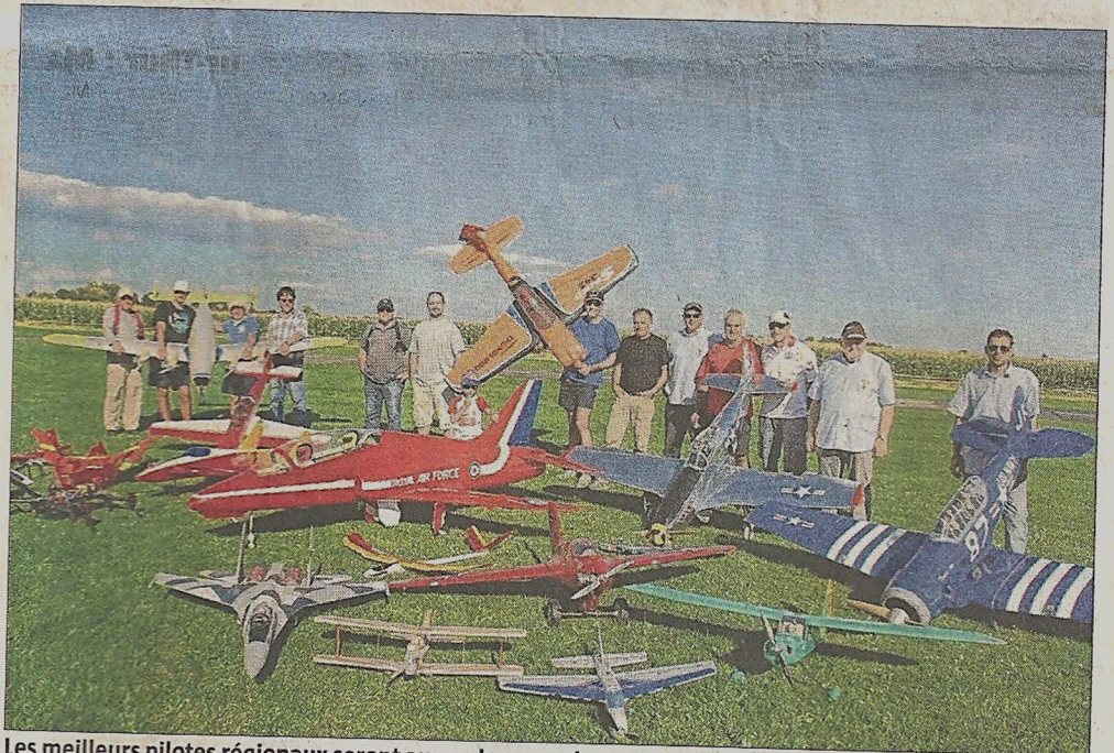
Les meilleurs pilotes régionaux seront au rendez-vous du meeting international d'aéromodélisme, dimanche 7 septembre.

« Cet événement crée aussi un lien entre les créateurs du club et les jeunes membres qui arrivent avec les toutes nouvelles technologies. Le club, aujourd'hui, compte une centaine de membres, une école de pilo-