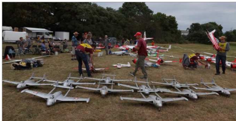
Une escadrille suisse.

Piloter un hélicoptère est plus difficile que piloter un avion ? C'est vrai dans le réel et dans le modélisme, un hélicoptère est plus difficile à monter et plus cher aussi, ce qui fait que c'est encore relativement rare. « J'aime construire les héli-