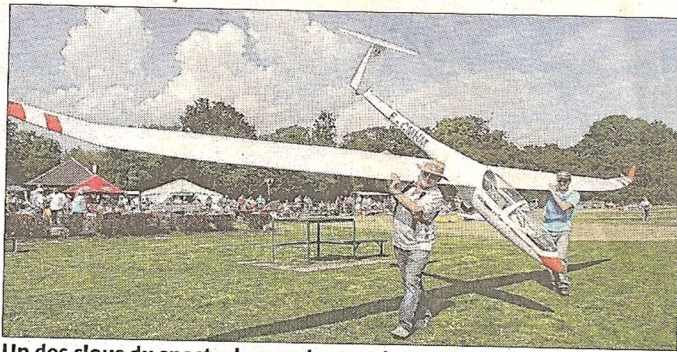
Un des clous du spectacle, un planeur de 9 m d'envergure.

Au-dessus des champs de maïs, acrobaties et voltiges ont tenu en haleine les spectateurs impressionnés par les performances des machines.