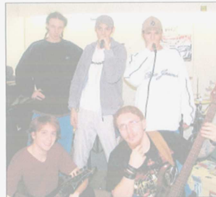
Le groupe « Smash Hit Combo » se produira sur la scène découverte du Noumatrouff, à Mulhouse, avec les autres groupes de Mix'Thur.