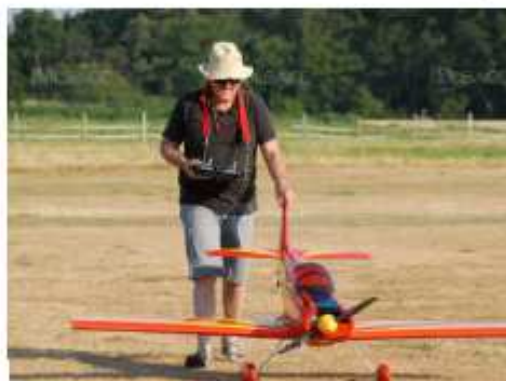
Apprendre à piloter un avion n'est pas chose aisée, loin s'en faut.