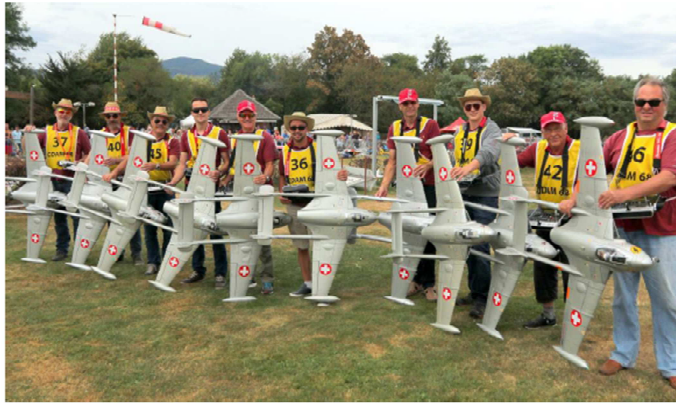
L'équipe suisse de voltige a été le choucou du public.

blic présent avec ses 5 vols de patrouille espacés sur la journée. Lors des décollages, les spectateurs ont pu admirer les prouesses techniques de ces as de l'aéromodélisme qui étaient hyperconcentrés, étant les garants de la sécurité de leur machine. Cette journée avait mobilisé une centaine de bénévoles et restera dans les annales du club. ■