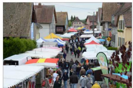
Malgré une météo maussade, il y avait du monde dans les allées de la foire aux râteaux, hier matin.