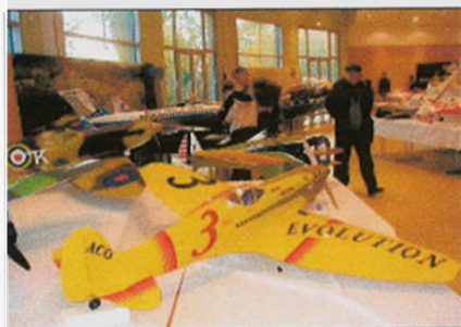
Les modèles réduits les plus impressionnants peuvent mesurer jusqu'à 3 mètres d'envergure et peser 20 kg.

Chaque modèle est une prouesse technologique, puisqu'ils mesurent jusqu'à 3 mètres d'envergure, peuvent peser 20 kg et sont mus par des moteurs de 10 à 80 cm 3 .