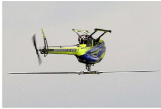
Hélicoptère de voltige 3 d Goblin 700, en vol sur le dos et en marche arrière.