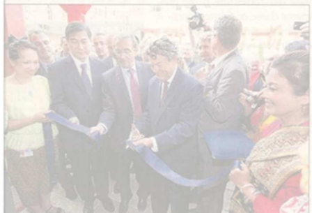
h-Louis Borloo, avec à sa droite Roland Ries et l'ambassadeur de ilande.

ministre d'État en charge de l'Écologie, Jean-Louis Borloo, a uguré, hier matin, la 78 e Foire européenne de Strasbourg, c son millier d'exposants, aux côtés du sénateur-maire de asbourg, Roland Ries, et de l'ambassadeur de Thaïlande en nce, représentant le pays invité cette année. Roland Ries s'est le porte-parole des attentes très fortes des élus alsaciens. us les dossiers de l'Alsace sont à l'heure », lui a répondu le liste, avant de défendre sa politique en faveur de minnement. Aujourd'hui, Jean-Louis Borloo suit officiellement à