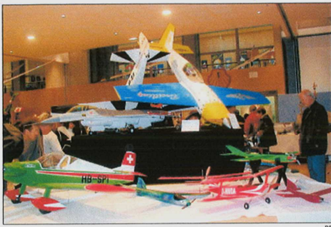
Les visiteurs pourront découvrir des planeurs, des avions de chasse, de voltige ou de transport et même une mini Patrouille de France.

quand ce ne sont pas de véritables turbines. Leurs réalisations ont