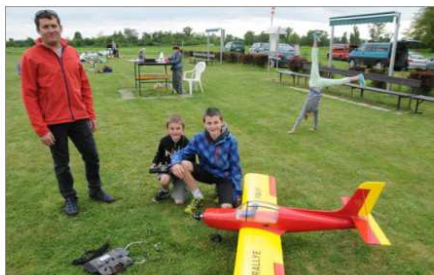
L'idée de cette journée d'initiation est de permettre ainsi à des enfants ou des adultes de faire voler en toute sécurité des avions-écoles.

Tout comme il n'est pas inné de savoir rouler à vélo, piloter un avion modèle réduit impose une période d'apprentissage. Pour cela, les leçons de pilotage se sont effectuées en direct sur le terrain avec du matériel en double commande. Après une durée d'information et une peti-