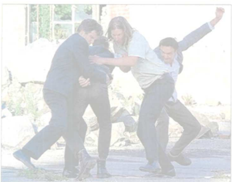
Le festival Premiers Actes s'est ouvert le week-end dernier, à Wesserling.

Jusqu'au 12 septembre, le 3 e festival Premiers Actes propose de faire découvrir au public alsacien de jeunes compagnies de théâtre et des spectacles inédits dans la région. Le week-end