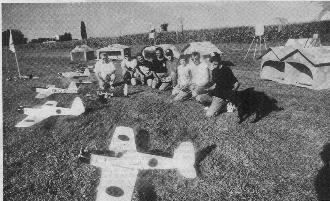
Les aéromodélistes préparent leur show...

Et comme la cavalerie chère à Lucky Luke (toujours en retard !), six avions américains de type T6 tenteront bien de