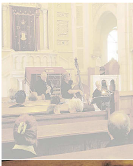
L'an dernier, la visite de la synagogue était agrémentée par un concert de musique juive.

Le thème retenu cette année est la musique juive. Faute de gros moyens, les organisateurs thannois ont dû se résoudre à contenter d'une manifestation de moindre envergure que celle de l'an dernier. Justement, l'an passé, la synagogue de la rue de l'Étang à Thann, avait accueilli un concert de musique juive. Un très bon moment pour les nombreux visiteurs qui avaient également pu entendre de poignants témoignages de membres de la communauté juive de Thann sur les temps d'horreur de la Shoah.