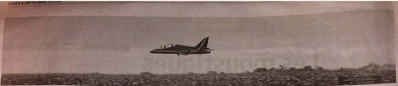
Passage bas et lâcher de fumigène pour ce modèle réduit de jet.

CERNAY 20e meeting international d'aéromodélisme