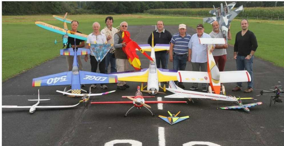
Une partie des membres du club posant avec leur modèle réduit.