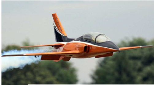
Passage du Vipe