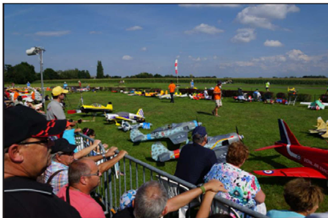
Le parc aux avions, toujours impressionnant.

Le club s'est installé en ces lieux en 1974. C'était juste un terrain où les premiers modèles évoluaient en l'air aux mains de pilotes pas toujours aguerris. Les crashes étaient fréquents. C'est là que les membres construisirent en 1978 une piste