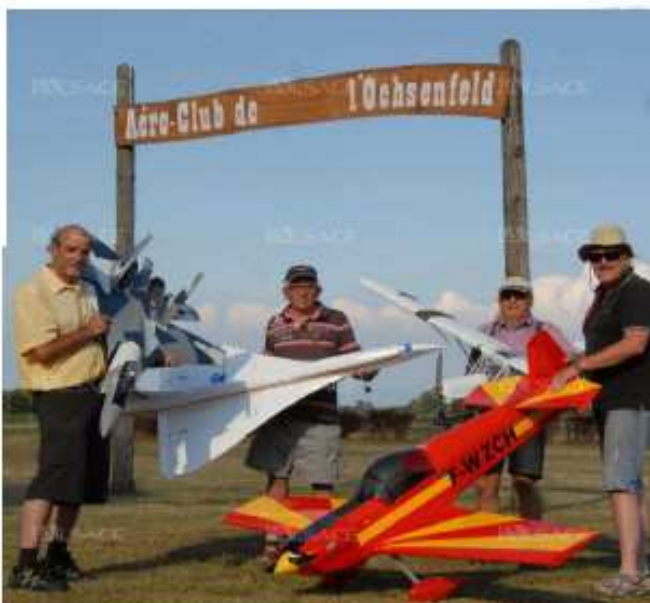
Le club propose une initiation au pilotage qui permettra aux enfants et aux adultes de faire voler des avions-écoles encadrés par des pilotes confirmés.

L'aéro-club possède d'intéressantes installations soigneusement entretenues par les membres. Il y a même une piste en macadam prolongée par une piste en gazon. Le club cernéen s'est aussi forgé une réputation de « constructeurs » de modèle originaux avec beaucoup d'échange, ou des chantiers en commun entre plusieurs modélistes. Les pilotes se retrouvent régulièrement dans cette ambiance « pionniers de l'aviation ». En effet, chaque premier vol d'un nouveau modèle, patiemment construit durant de longues heures d'hiver, est un événement