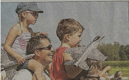
Petits et grands ont suivi avec émerveillement les démonstrations de vol des mini-avions, dans un ciel bleu azur.

■ SURFER Diaporama sur notre site internet, www.lalsace.fr